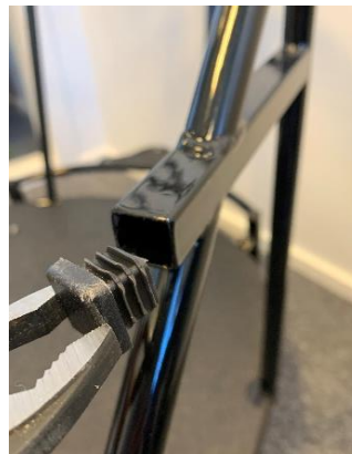
Trekk plaststopperen ut