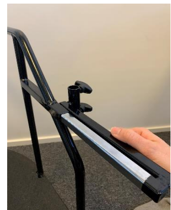
Plasser beslaget slik at festet for aktivitetsbøylen er på utsiden av rammen