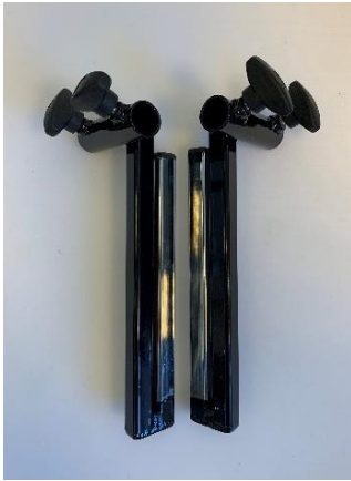
Monteringsbeslag til aktivitetsbøyle